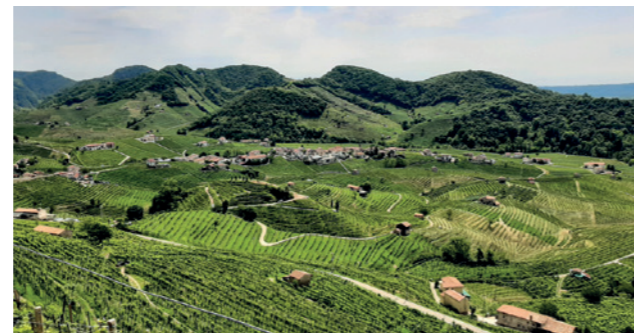
Colline/Hills di Valdobbiadene

Il patrimonio della tradizione, la forza dell'innovazione