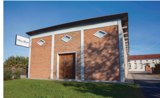
Anna Spinato Winery